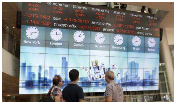
להשקיע בחברה שלא עושה דבר: שובן של חברות הבורסה