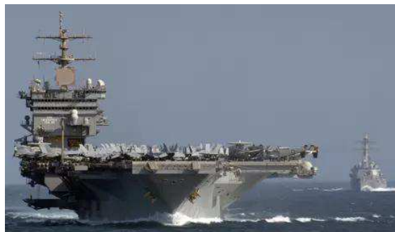
15 מיליארד דולר בשנה: למה נתניהו איים על איראן?