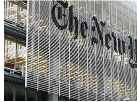
גלובל "ניו יורק טיימס" מנן על כתבת שכנתה לבנים "כלבים"...