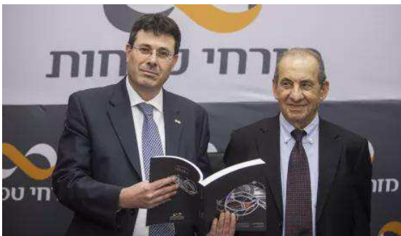
בנקים יקרים: מניות המגזר זינקו אתמול ב-1.7%; זכפיל ההון הממוצע - יותר מ-1