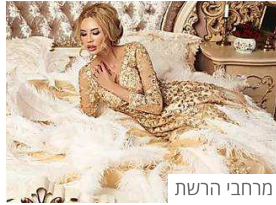
מרחבי הרשת עמינח מי הדיווה שישנה 15 שעות? הרגלי השינה של הסלבס