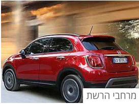
מרחבי הרשת iCar אל תקנו רכב חדש לפני שתציצו ברכב הבא