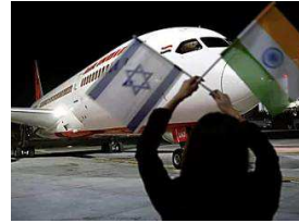
צרכנות אל על מושכת את העתירה נגד המדינה ואייר אינדיה